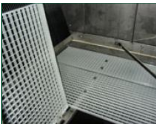
Plate-forme de maintenance interne

Des lignes de lubrification prolongées équipées de graisseurs facilement accessibles peuvent être mises en oeuvre pour lubrifier les paliers d'arbre de ventilateur.