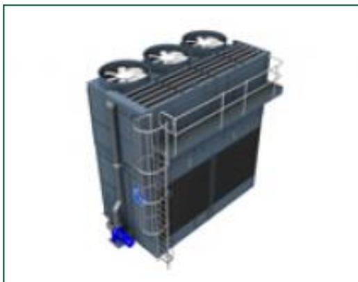
Plate-forme de maintenance externe

La plate-forme externe vous permet d' accéder au sommet des installations extérieures et d'inspecter votre équipement de refroidissement en toute sécurité.