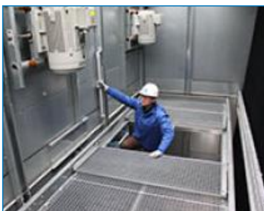
Plate-forme de maintenance interne

La passerelle interne offre un accès aisé au bassin d'eau des installations .