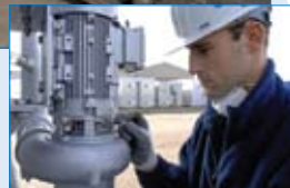
Elk BAC-onderdeel heeft unieke technische gegevens