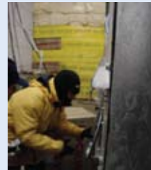
Temperatuurproeven beneden het vriespunt

Daarom is BAC dé aangewezen partner om uw onderdelen te vervangen als u uw apparatuur zo lang mogelijk optimaal wilt laten functioneren en de uitvalsfrequentie minimaal wilt houden .