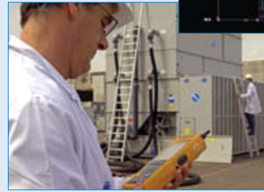
Temperatuurproeven op een koeltoren

Daarom is BAC dé aangewezen partner om uw componenten te vervangen als u optimale waarborgen wilt qua bedrijfsrendement en prestatievermogen .