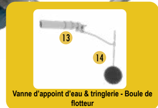
Vanne d'appoint d'eau & tringlerie - Boule de flotteur