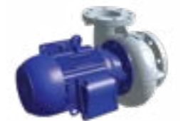
Pompe de pulvérisation avec volute

Ceci n'est pas un bon de commande officiel.