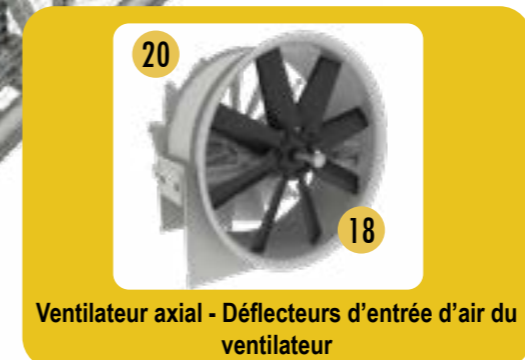
Ventilateur axial - Déflecteurs d'entrée d'air du ventilateur