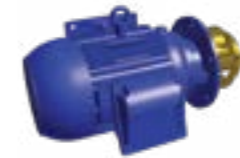
Pompe de pulvérisation sans volute*