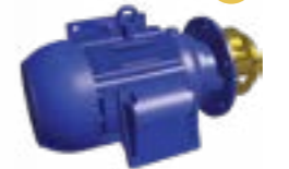
Bomba de pulverización sin voluta