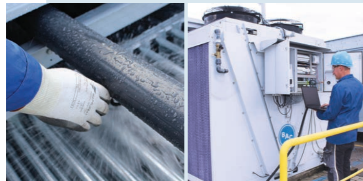
Vorbeugende Wartung und qualifizierte Reparaturen

Alles für den kosteneffektivsten und zuverlässigsten Betrieb Ihrer Ausrüstung.