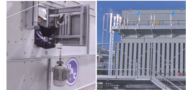
Aufrüstungen und neue Technologien

Diese Aufrüstungen sind unerlässlich, um die Effizienz Ihrer Aufrüstung zu verbessern und neue Vorschriften zu erfüllen.