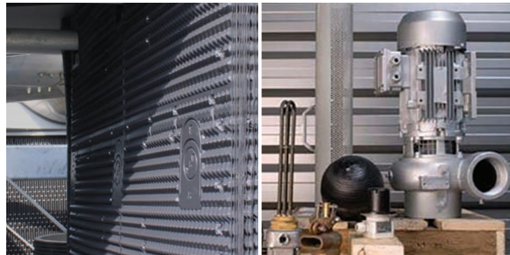
Originalersatzteile und Füllkörper

Die Verwendung von BAC-Originalersatzteilen gewährleistet, dass sie gleich beim ersten Mal passen, und bietet eine vollständige Rückverfolgbarkeit Ihrer Gerätehistorie.