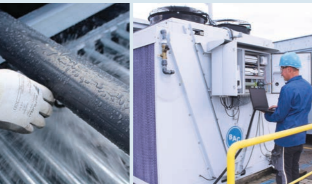
Vorbeugende Wartung und qualifizierte Reparaturen