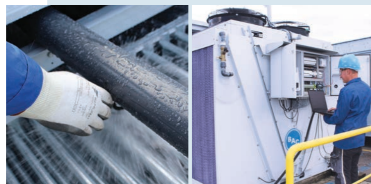
Manutenzione preventiva e riparazioni qualificate

Tutto per il funzionamento più sicuro ed affidabile delle vostre apparecchiature.