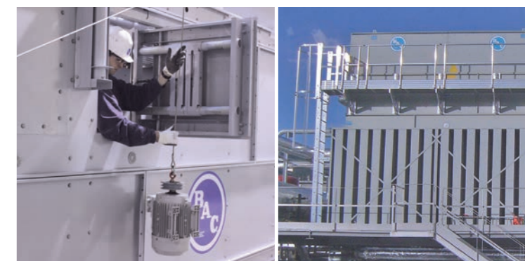
Aggiornamenti e nuove tecnologie

Questi aggiornamenti sono essenziali per migliorare l'efficienza delle vostre apparecchiature e ottenere conformità a qualsiasi nuova normativa .