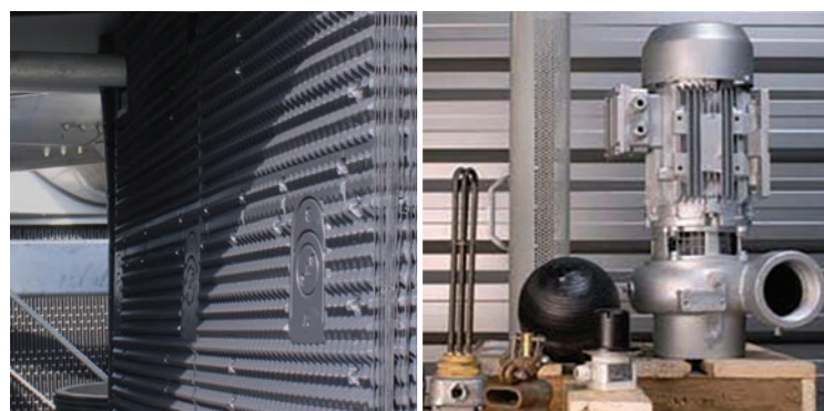
Parti di ricambio e riempimenti originali

L'utilizzo di parti originali BAC garantisce la totale idoneità e offre una completa tracciabilità della storia delle vostre apparecchiature.